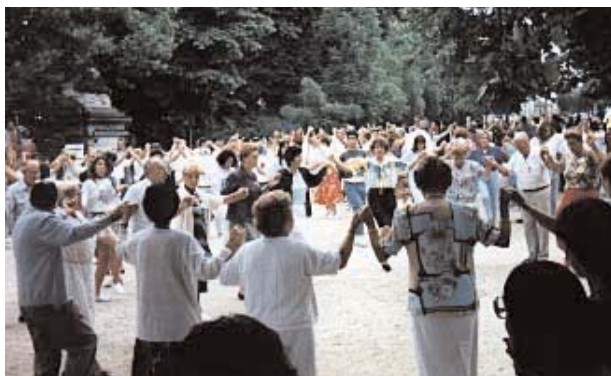
L'Aplec Internacional de la Sardana de 1992.

Barcelona, 25 d'abril de 2004 Dia Internacional de la Catalunya Exterior