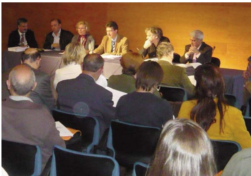
Assemblea General de la FIEC 2008 a Tarragona.

Sortosament, els instruments de representació de les CCE davant l'administració de la Generalitat s'han ampliat i reforçat des de l'adopció, l'any 1996, de la Llei 18/1996 de relacions amb les comunitats catalanes de l'exterior. Una llei que després de 14 anys de vigència precisa, com qualsevol altra norma, d'una posada al dia i d'una actualització. La creació, com fixa aquesta Llei, d'un Consell de Comunitats Catalanes de l'Exterior, on hi participen 11 persones de les CCE designades per la Generalitat, ha permès, en les seves reunions anuals, fer arribar de forma directa a l'administració les preocupacions diàries de les CCE en les matèries en que la Generalitat i aquest Consell són competents. La FIEC dona i donarà total suport a la feina dels representants de les CCE al Consell atès que les funcions d'uns i altres, FIEC en el dia a dia i Consell en les seves reunions anuals o semes-